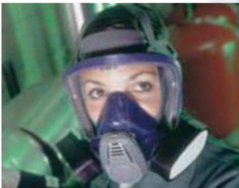
Advantage 3200 con Filtro de Gas TabTec®

Aire limpio para respirar es esencial para vivir. Por ello, nada es más importante que el aire puro, especialmente si se tiene que trabajar en un ambiente contaminado.