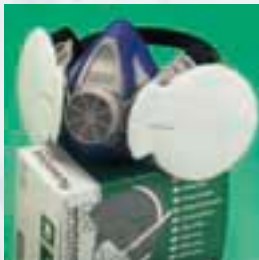
La nueva tecnología de filtros para partículas, gas y mixtos de la Gama Advantage para la Advantage 200 LS

La Advantage 200 LS se compone de una pieza facial, un yugo de 4 puntos, válvulas de inhalación y exhalación y el arnés de cabeza. Además pueden acoplarse variedad de filtros de partículas, gas y mixtos.