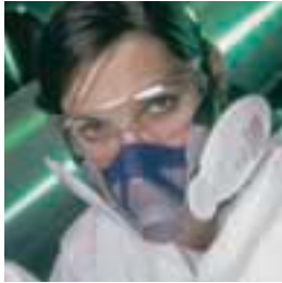
Advantage 200 LS con Flexifilter