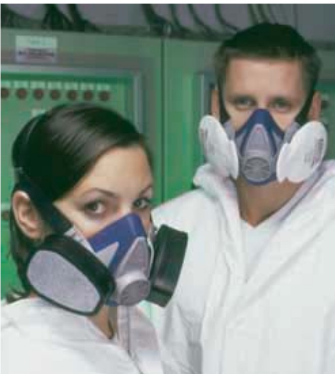
La mascarilla Advantage 200 LS

MSA ha mejorado notablemente el equipo filtrante Advantage 200. El resultado es la Advantage 200 LS de mayor rendimiento, económica y de fácil manejo.