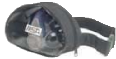
La genuina bolsa de cintura útil para guardar y transportar la Advantage