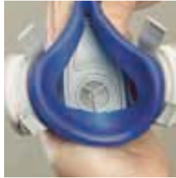
La pieza facial AnthroCurve