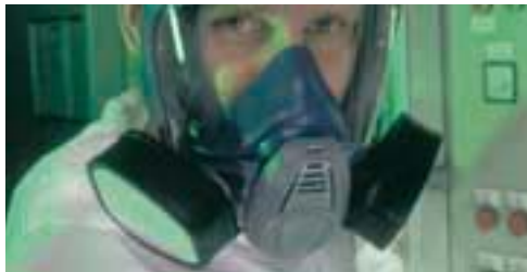
Advantage 3200 con filtro TabTec®

Los filtros contra gases tóxicos o inodoros deben sustituirse después de usarlos una vez. El término de la vida útil de los filtros de partículas se determina subjetivamente cuando se incrementa la resistencia respiratoria.