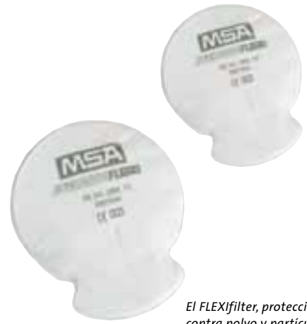
El FLEXifilter, protección contra polvo y partículas FLEXifilter

Los FLEXifilter son adecuados para aplicaciones donde existan aerosoles de partículas y olores. Puesto que los filtros caben holgadamente bajo las pantallas de soldador, se utilizan frecuentemente para esta aplicación.